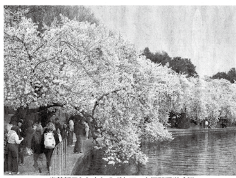
米首都ワシントンのポトマック河畔で咲く桜＝3月

後、接ぎ木で増やされた桜が「シドモア桜」としてシドモアにゆかりのある神奈川県、富山、岩手、石川県など約50カ所に植樹され、美しい花を咲かせている。松山市とシドモアとの関係はあまり知られていない。シドモアが書いた記録小説「日露戦争下の日本〜ハーク条約の命ずるままに〜」の舞台が松山市だった。小説はすでに絶版となったが、日露戦争中に松山市内で収容されていたロシア軍人捕虜の妻の日記の舞台が松山市だった。小説はすでに絶版となったが、日露戦争中に松山市内で収容されていたロシア軍人捕虜の妻の視点で、約1年半の滞在中に接した松山市の人々の優しさを併せて、日露戦争中に松山市内で収容されていたロシア軍人捕虜の妻の日記の舞台が松山市だった。小説はすでに絶版となったが、日露戦争中に松山市内で収容されていたロシア軍人捕虜の妻の視点で、約1年半の滞在中に接した松山市の人々の優しさを併せて、日露戦争中に松山市内で収容されていたロシア軍人捕虜の妻の日記の舞台が松山市だった。