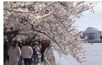
ワシントン中心部に流れるポトマック川沿いで桜を見る観光客ら

シドモア女史は兄が外交官として横浜市にあった総領事館に勤務しており、1884（明治17）年頃に初来日してから日本を度々訪問。滞在中に東京・隅田川で見た桜の美しさと桜を愛する日本人の姿に心を打たれ、帰国後20年以上にわたってワシントンのポトマック河畔を桜の名所にするのを提唱し続けた。旧知の間柄だった当時のタフト大統領夫人の賛同を得たのを機に、1912年に当時の東京市の尾崎行雄市長から日米友好の証しとして約3千本の桜の苗木が届けられ、それが今のポトマック河畔の桜並木につながっている。