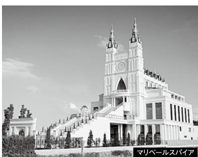
マリベールスパイア

〔結婚式場〕 マリベールスパイア ハイダウェイ グレイスガーデン アルベラ 〔葬儀会館〕 天山・枝松・プライベートホール緑(枝松) 道後・空港通・鷹子・土居田・三津 貸切ホールベルモニー結 松ノ木・吉藤 プライベートホール緑(吉藤)・川内 重信・松前・伊予 〔互助会〕 ベルモニー松山 人生をつなぐ。 株式会社ベルモニー http://bellmony-west.jp 791-8012 愛媛県松山市姫原三丁目4-13 Tel.089-911-0980 Fax.089-922-9800